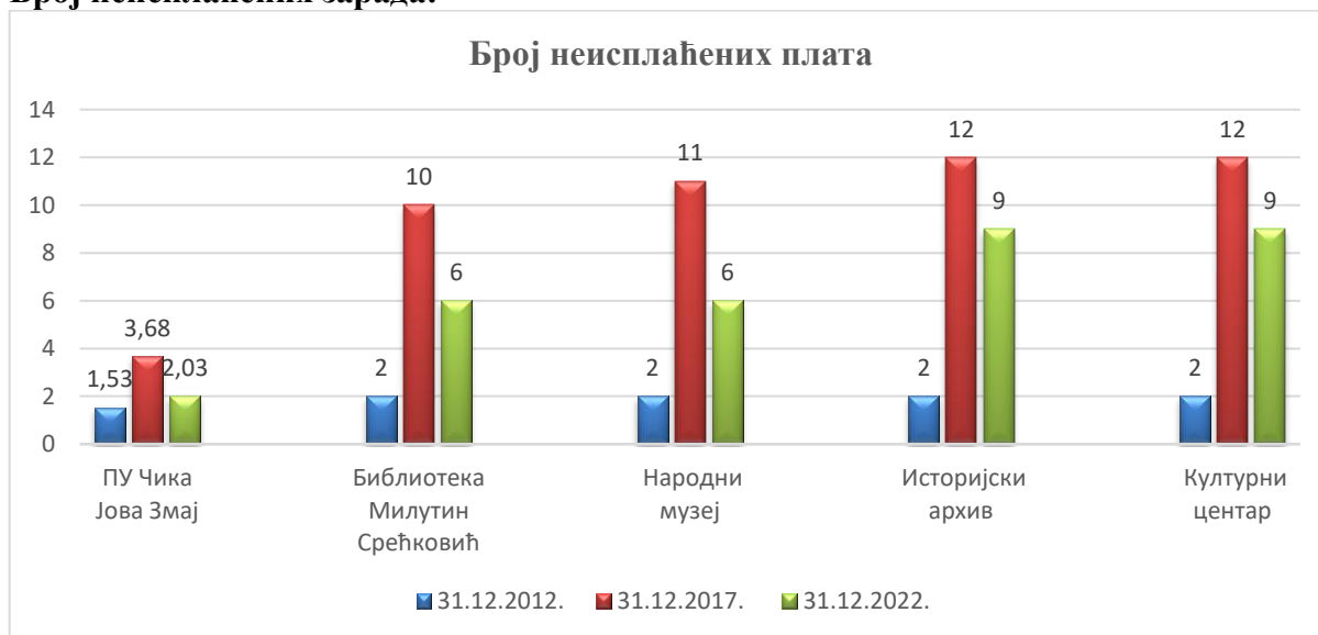
Дијаграм број 3: Број неисплаћених плата по годинама за које је вршена ревизија